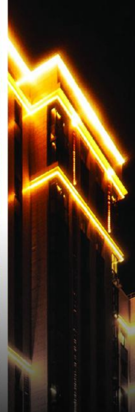
Gestion de patrimoine